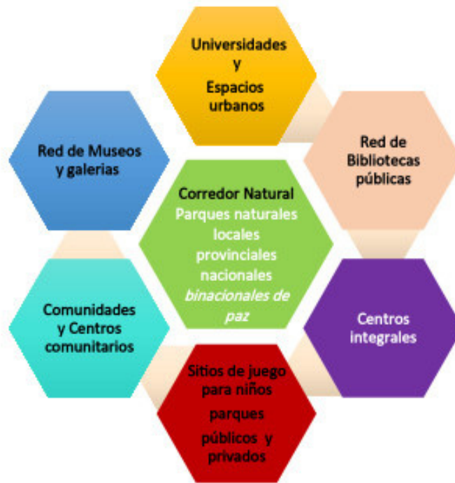
Gráfico No. 1 Visión general social, cultural, ambiental y recreativa de Calgary.

Disfrute de la Naturaleza: Se promueven actividades saludables al aire libre, además de que existe una estrategia de información importante por diferentes vías que invita a ejercitarse, a las caminatas en familia, paseos en bicicleta, recorridos en los bosques y parques naturales. Destaca la formación ciudadana que repercute en el cuidado de los espacios comunes y ambiental, también incluye aspectos claves como la cultura canadiense, el respeto a la diversidad, normas de prevención y cuidado en cada estación y de convivencia. En la Provincia de Alberta se encuentra el primer parque internacional de paz en la frontera entre Estados Unidos y Canadá, desde 1932. Comprende el Parque Nacional de Waterton Lakes en Canadá y el Parque Nacional Glacier ubicado en el Estado de Montana en Estados Unidos, un corredor natural desmilitarizado orientado a la preservación del ambiente, la investigación y el turismo.