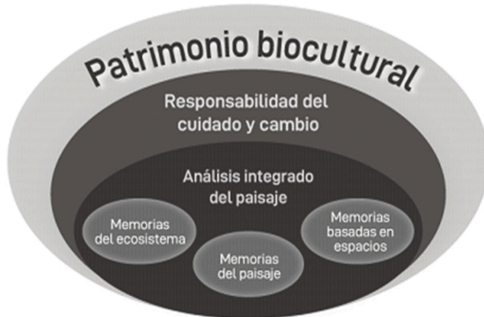
Figura 1. Patrimonio biocultural.

Patrimonio biocultural se refiere a todos los elementos culturales y elementos de biodiversidad que conviven y se relacionan en un mismo espacio, interactuando entre sí a partir de la acción y concepción del ser humano, siendo una unidad indivisible, en donde su existencia y sostenibilidad depende de la relación entre los mismos.