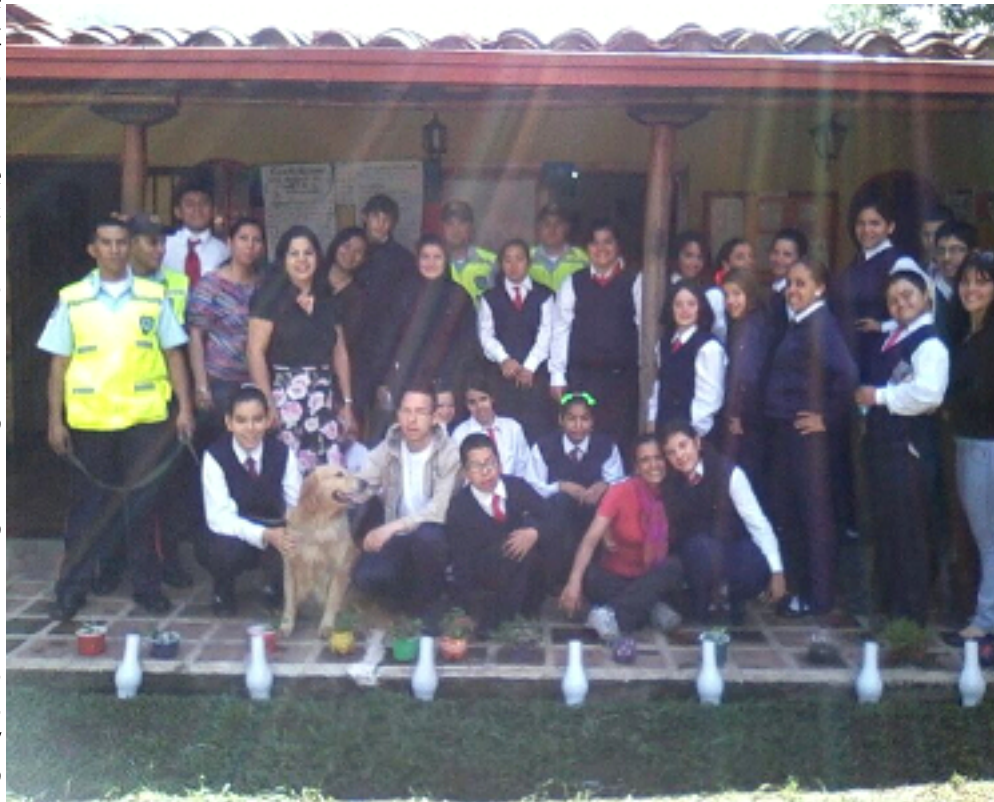
Unidad educativa en Hospitalidad y Turismo del estado Mérida

En consideración a lo expuesto, la relación interdisciplinaria de la hospitalidad y el turismo con áreas como sociología, economía, deontología, antropología, tecnología y gastronomía, en el estado Mérida, por su condición de región turística por excelencia, es una potencialidad para el aprovechamiento ecológico y productivo en diferentes ámbitos.